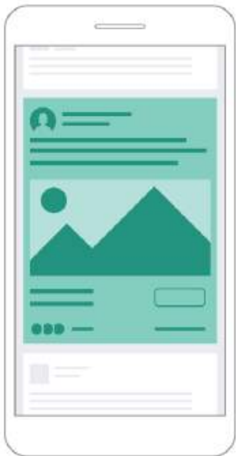
Facebook Search Results