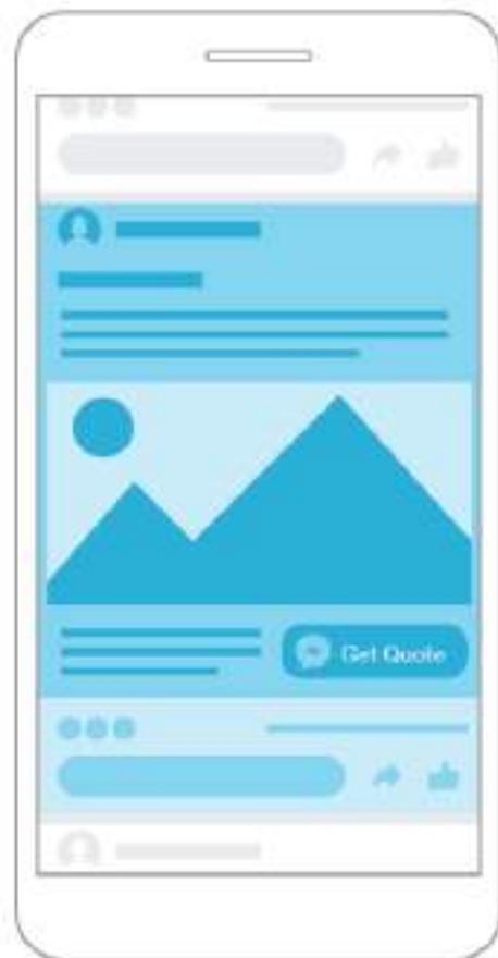
Messenger Sponsored Messages

Mensajes publicitarios de Messenger: los anuncios se muestran como mensajes a las personas con las que ya tienes una conversación en Messenger.