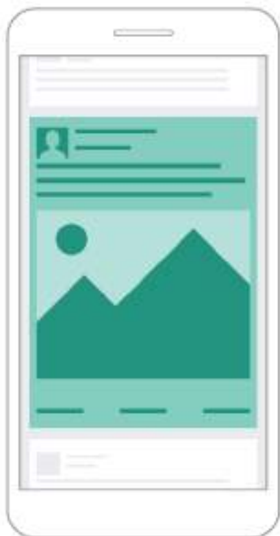
Facebook Instant Articles